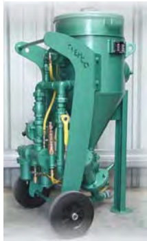
MODELE 40 L FOND CONIQUE Spécial produits fins