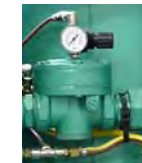
KIT REGLAGE PRESSION