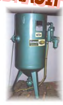
MODELE 300 L DOUBLE CHAMBRE Pour grenailage en continu