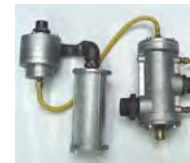
COMMANDE A DISTANCE EN 2 PARTIES