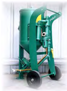
MODELE 60 L STANDARD Pour travaux courants