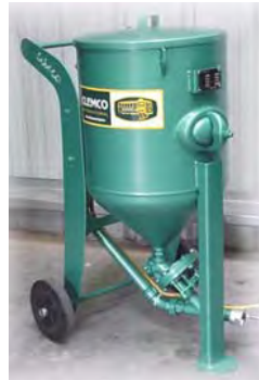
MODELE 100 L STANDARD Pour travaux courants