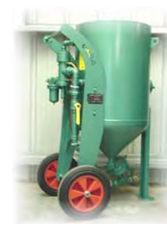
MODELE 200 L STANDARD Pour travaux courants