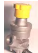
DOSEUR D'ABRASIF PNEUMATIQUE