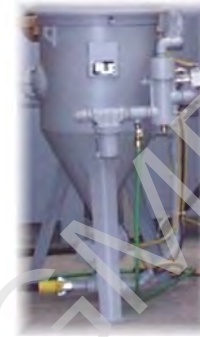
MODELE 100 L FOND CONIQUE Spécial produits fins