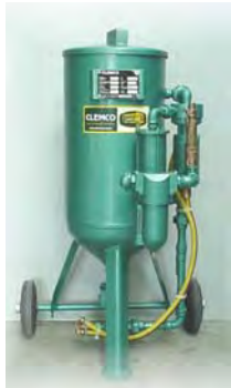
MODELE 20 L Pour microsablage