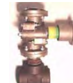
DOSEUR SPECIAL GRENAILLE